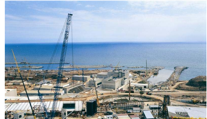
Empresa Metropolitana de Saneamiento (2000-2006)