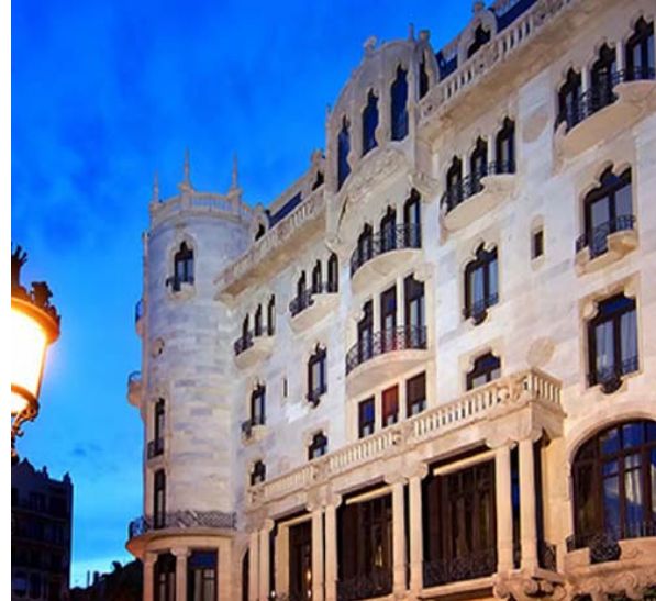
Hotel Casa Fuster 5*GL (2004) Rehabilitación edificio singular diseñado por Lluís Domènech en 1911 Edificio declarado monumento nacional