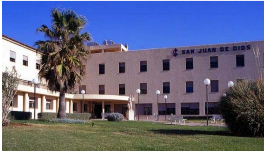
Hospital Sant Joan de Déu – Mallorca (2006-2007) Geriátrico