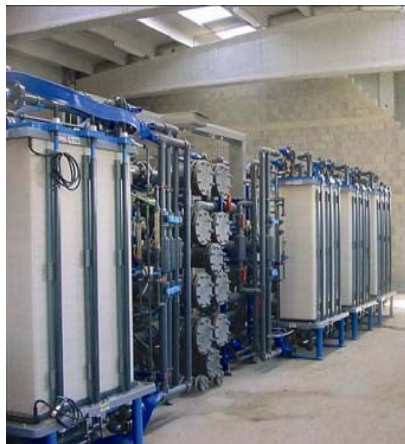
ECG El Prat (2004) Planta de desalinización