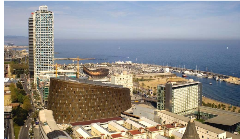
Hospital del Mar and Barcelona (2004)