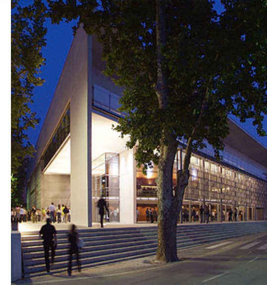
Auditori/Palau de Congressos Girona (2006) Nuevo edificio de 10.000 m2 para 2000 personas