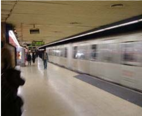
Metro L9 BCN (en ejecución) Línea más larga de Europa con 45 km atraviesa la ciudad de Barcelona desde el este al oeste y conecta con poblaciones vecinas