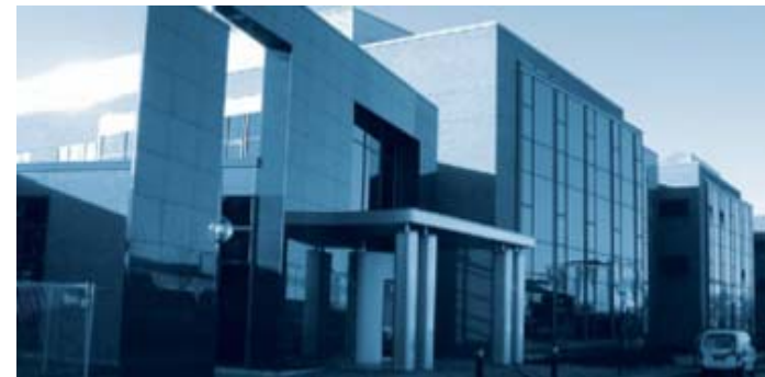
LEO Pharma (2005) Planta Farmacéutica en León , instalaciones eléctricas y mecánicas