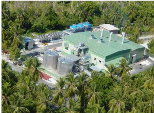
Planta de tri-cogeneración de energía para garantizar el suministro eléctrico a un grupo hotelero.