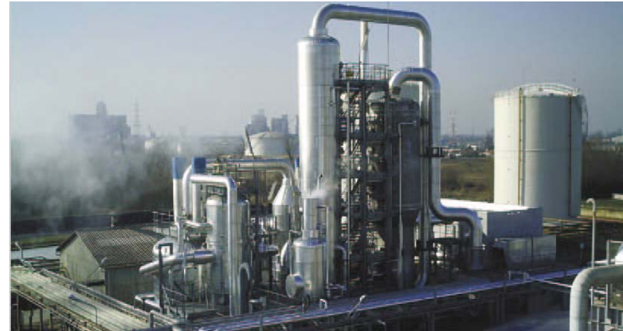
CASCO Industrie SAS (2006) Planta de Formol en Burdeos, Francia