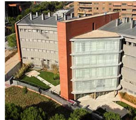
Grupo SAR, Madrid (2003) Geriátrico y centro de salud