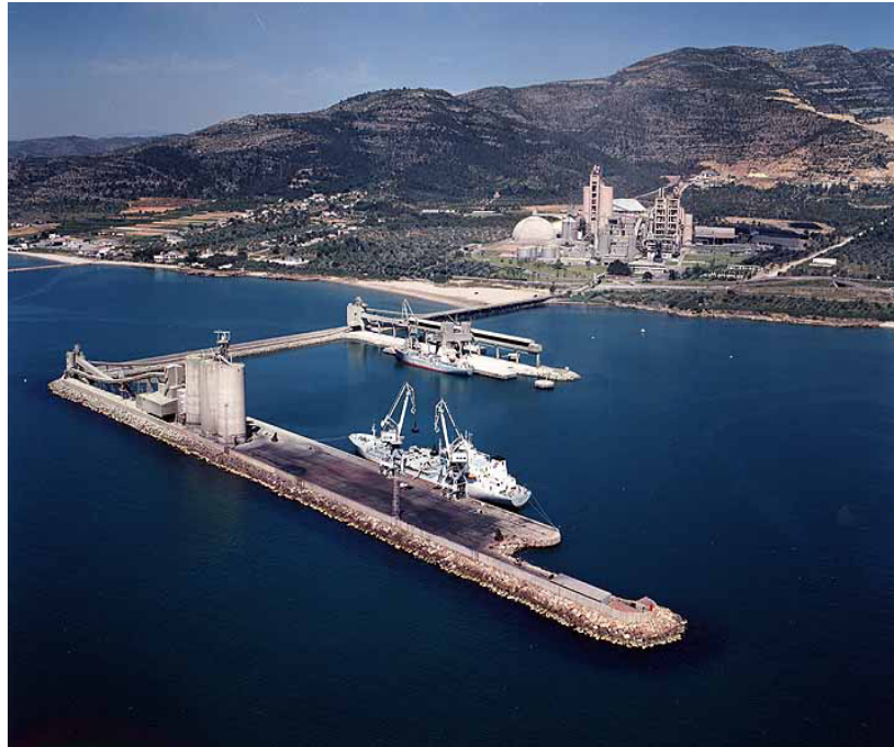
CEMEX (2006) Sistemas de automatización y control para la planta de cemento de Alcanar España