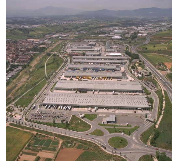
CIM Vallès (1992-98) Plataforma logística, desde el diseño hasta la ejecución y mantenimiento 442.000 m2