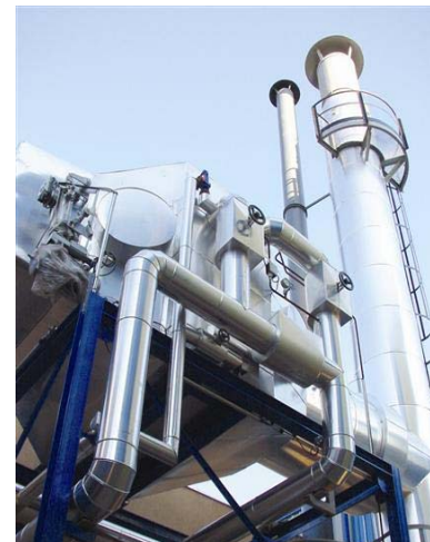
ARUSA, Rubí (2002) Llave en mano planta de tratamiento de fangos