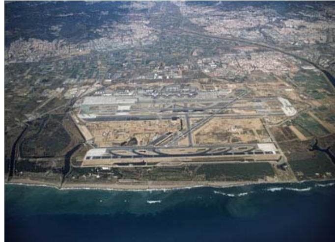
Aeropuerto internacional de Barcelona (en ejecución) Tres pistas operativas