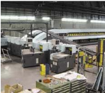
Correos (desde 1978, en ejecución) Mantenimiento de las instalaciones mecánicas