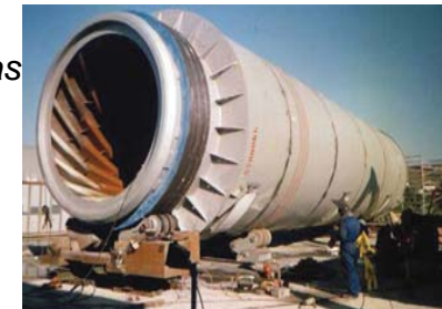
Estaciones de compresión de gas para optimizar el transporte del gas (desde 2002)