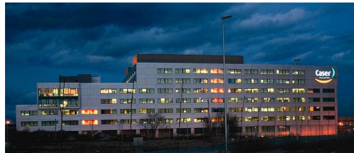
Oficina Central CASER (2004)