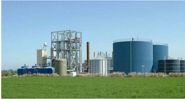
VAG Juneda (2005) Diseño, construcción y operación Planta de tratamiento de purines utilizando proceso patente Valpuren© ABANTIA'