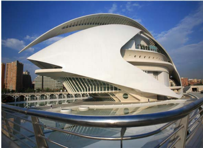
Palau de les Arts Reina Sofia (2005) Nueva Opera diseñado por Calatrava 37.000 m2