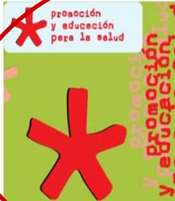
Promoción y Educación para la Salud