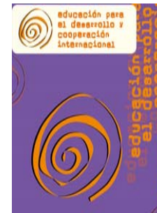
Educación para el Desarrollo y Cooperación Internacional