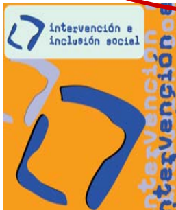
Intervención e Inclusión Social