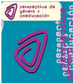
Perspectiva de Género y Coeducación